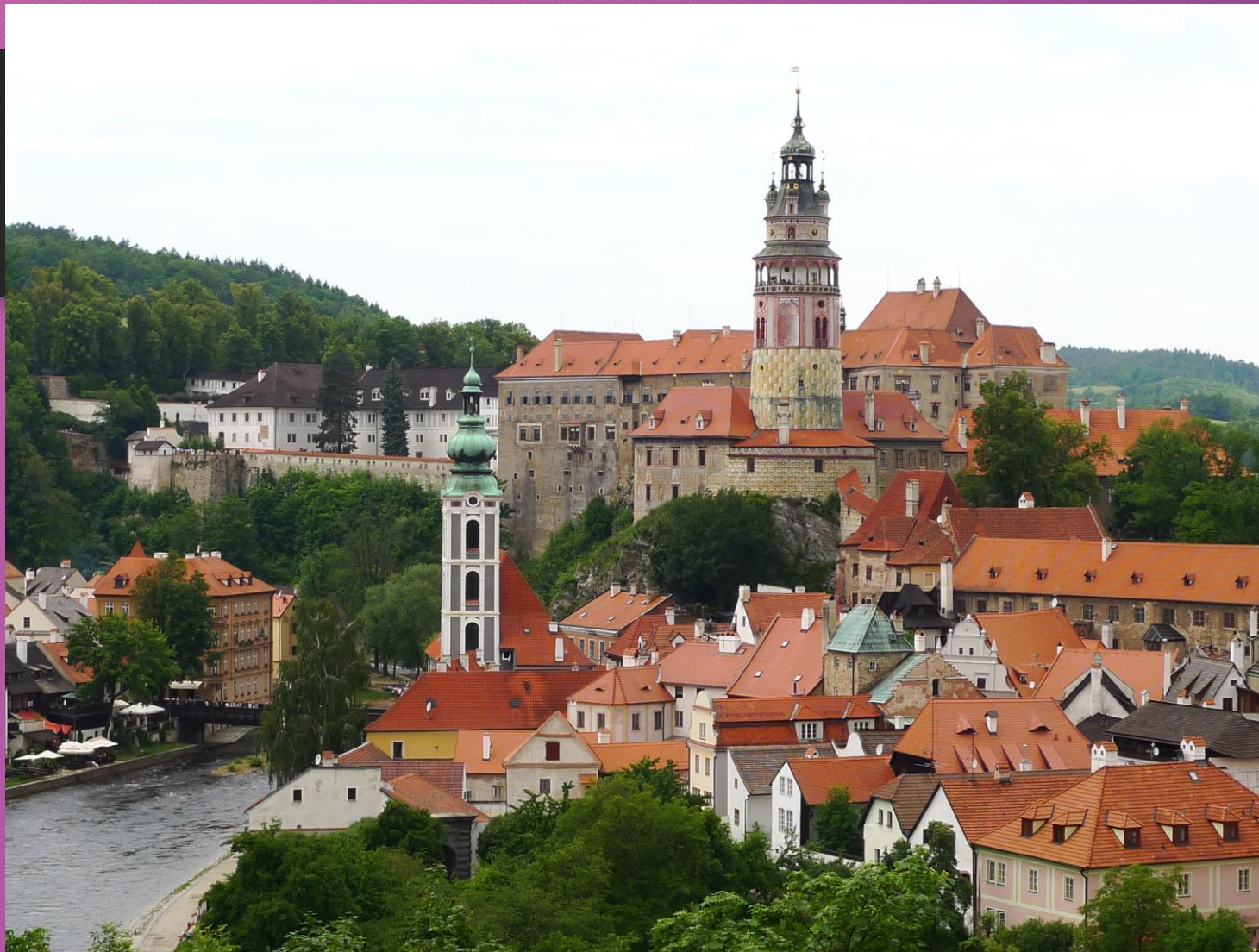
Obr. 10 Panorama Českého Krumlova. Také krumlovští páni odvozovali svůj původ z rodu Vítkovců. Jedinečné historické centrum města je od roku 1992 zapsáno na seznamu světového dědictví UNESCO.