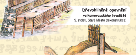
Dřevohlinité opevnění velkomoravského hradiště 9. století, Staré Město (rekonstrukce)