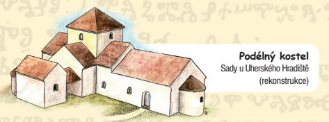
Podélný kostel Sady u Uherského Hradiště (rekonstrukce)