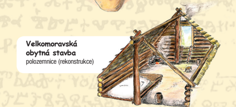
Velkomoravská obytná stavba polozemnice (rekonstrukce)