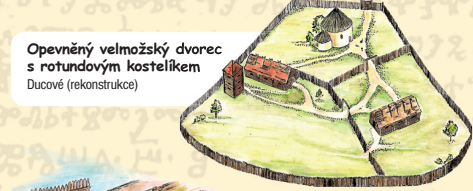
Opevněný velmožský dvorec s rotundovým kostelíkem Ducové (rekonstrukce)